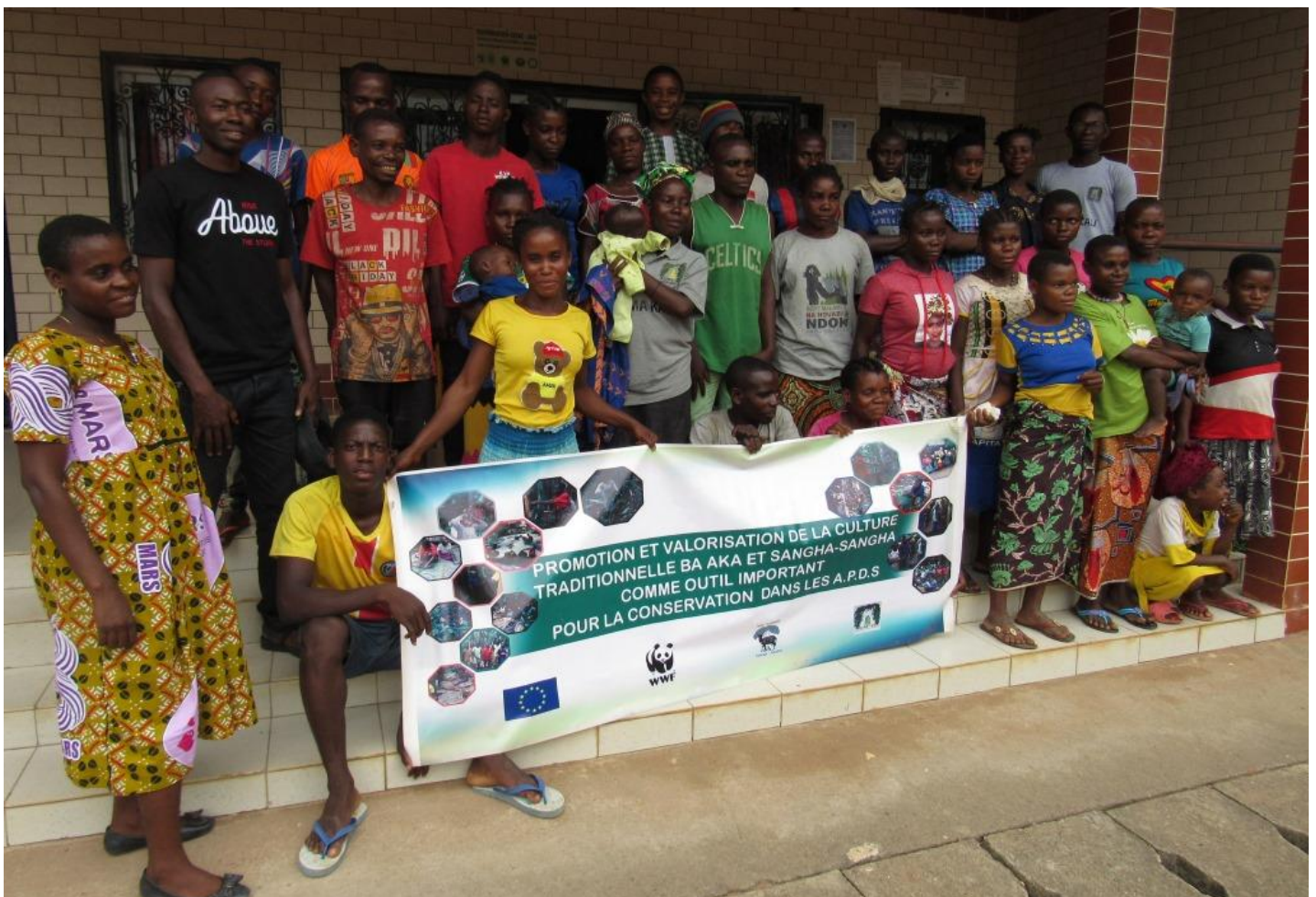
Photo de famille lors de l'assemblée générale