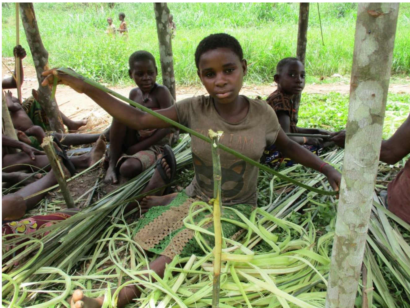
Image tressage des nattes traditionnelles

Pour cette année 2023, 1710 jeunes ont pris part à ces ateliers d'apprentissage.