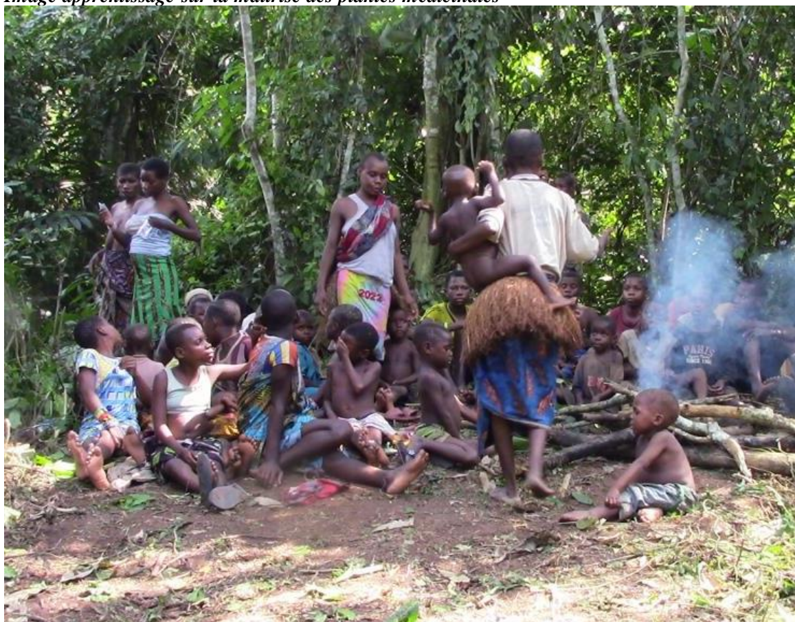
Image atelier de contes et histoires avec les enfants