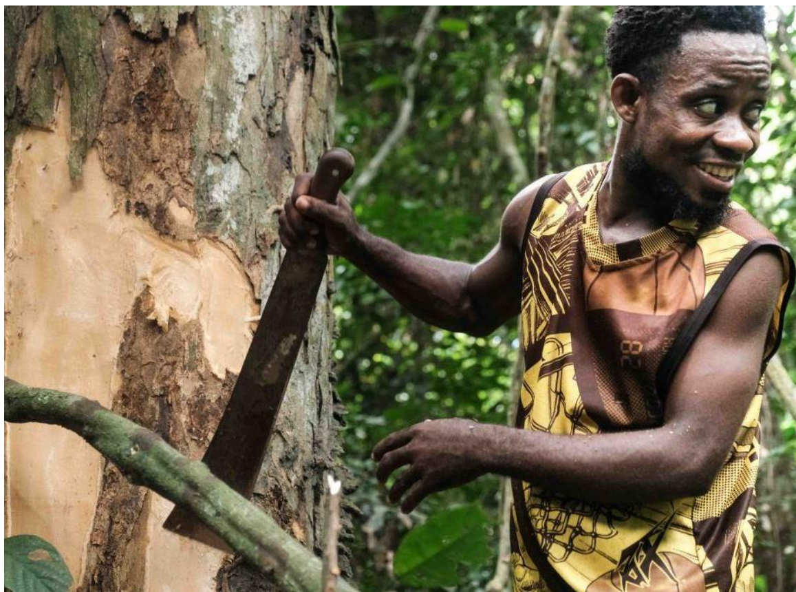
Image apprentissage sur la maîtrise des plantes médicinales