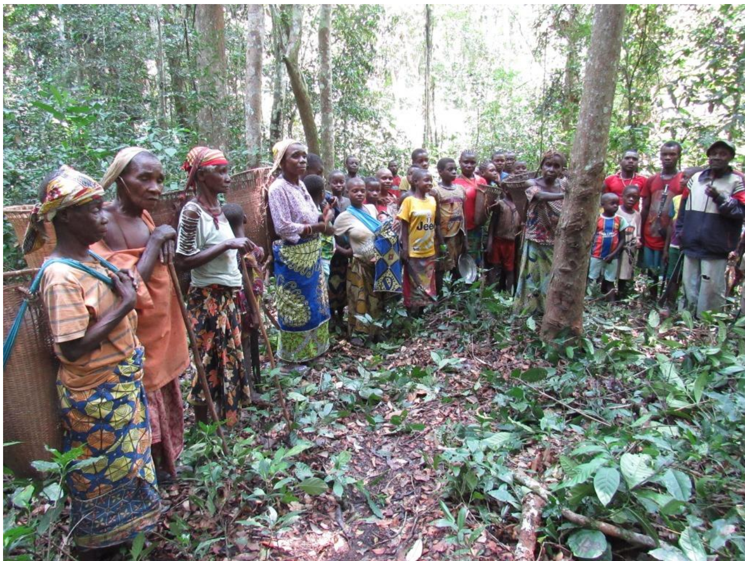
Image rituel de purification appelé MAKOSSÉ