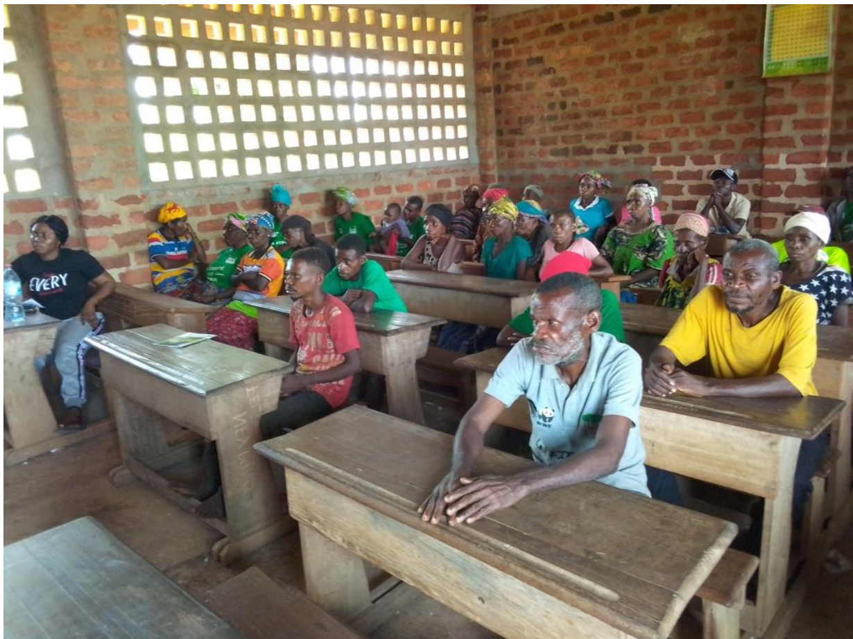
Image conseil des doyens à Mona-Sao